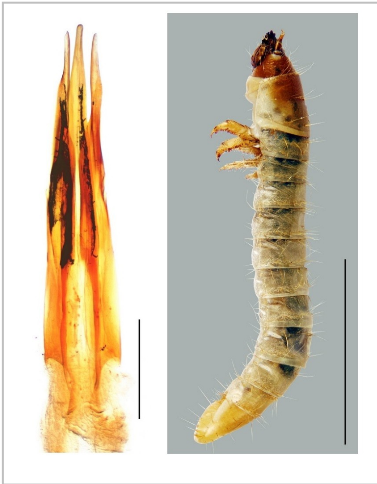
Figuras 2-3. 2. Edeago de Ptilodactyla exotica Chapin, 1927. Escala 0,2 mm.; 3. Larva de Ptilodactyla exotica Chapin, 1927, recolectada en Barcelona. Escala 2 mm.